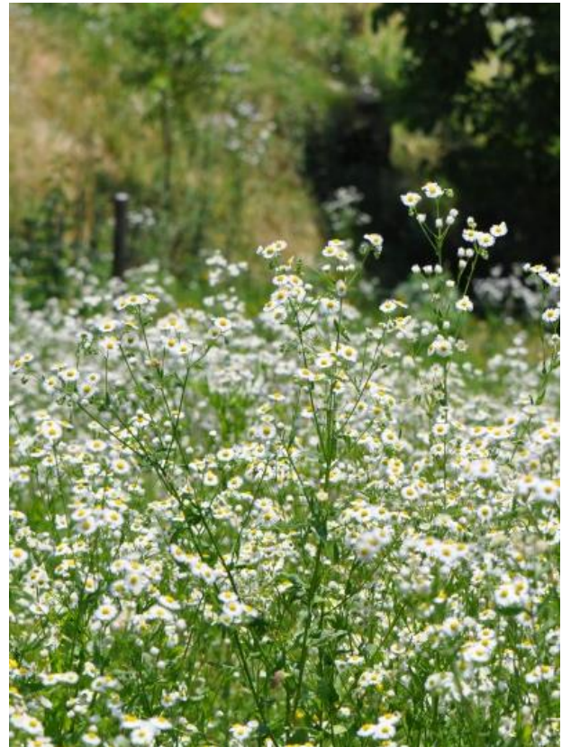
Erigeron annuus