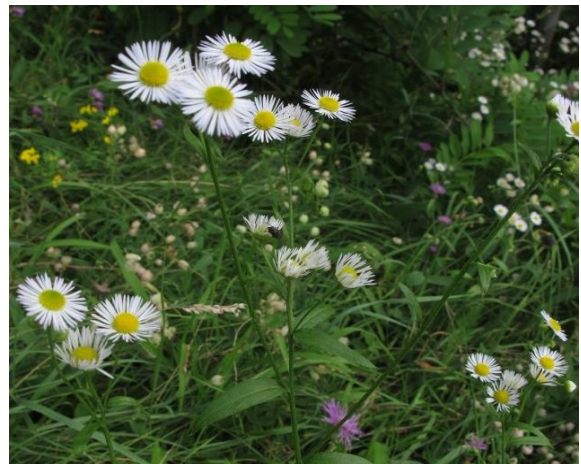
Erigeron annuus